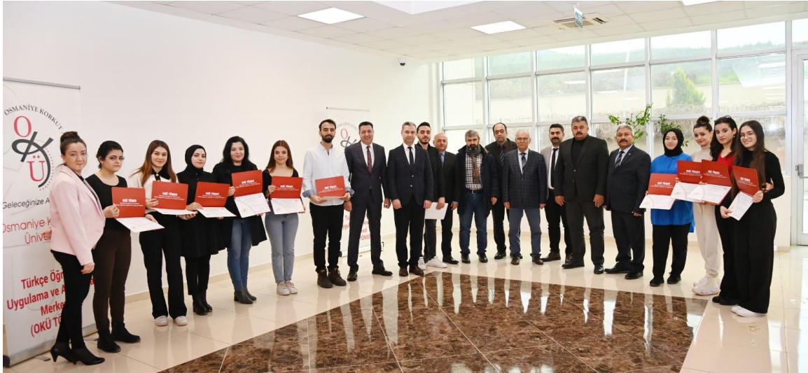
Resim 4: OKÜ TÖMER Katılımcı Sertifika Belge Teslimi

Aralık ayında düzenlenen "Yabancı Dil Olarak Türkçe Öğretimi Sertifika Programında" mesleki bilgi ve becerilerini geliştirmek isteyen 23 kursiyer, 30 saat teorik ders ve 20 saat staj uygulamasından oluşan programda başarı göstererek sertifika almaya hak kazandı.