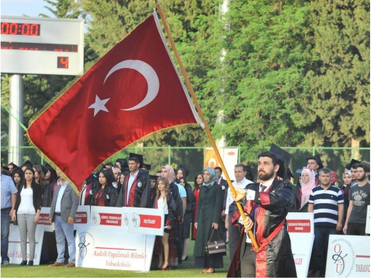
Resim 6: OKÜ Mezuniyet

8- Öğrencilerin ve halkın kullanımına yönelik içerisinde sauna ve buhar hamamı bulunan 1 yarı olimpiik yüzme havuzu, halı saha, 2 tenis kortu, FİFA standartlarına uygun çim saha, fitness salonu, 2 squash salonu, çeşitli spor alanları, önlisans, lisans ve lisansüstüne yönelik laboratuvarlar donanımlı çalışma alanları aktif olarak hizmet vermektedir.