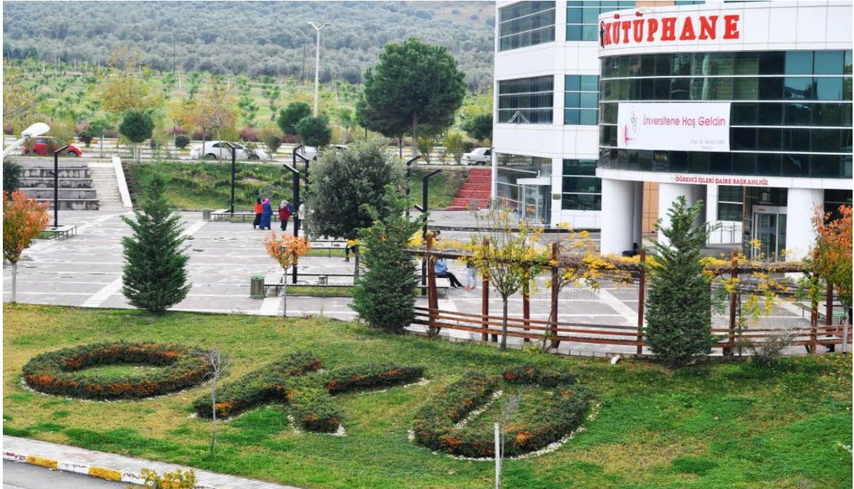
Resim 5: OKÜ Kütüphane