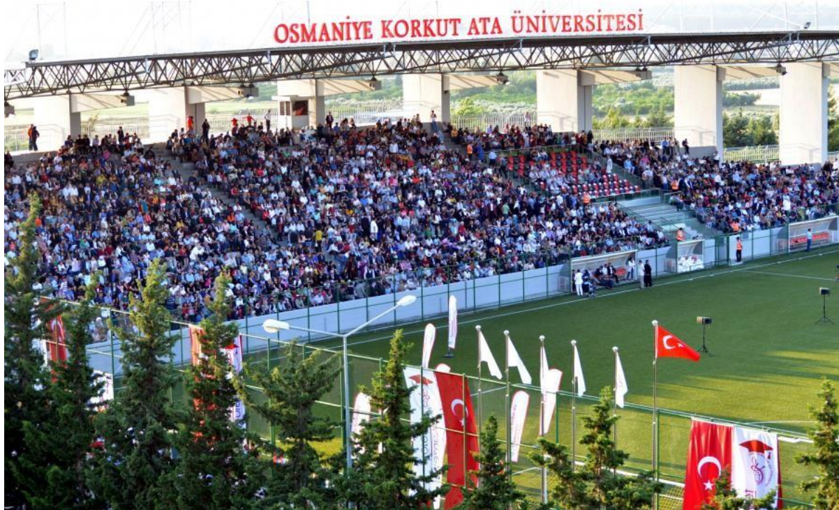
Resim 4: OKÜ Karacaoğlan Yerleşkesi Spor Kompleksi