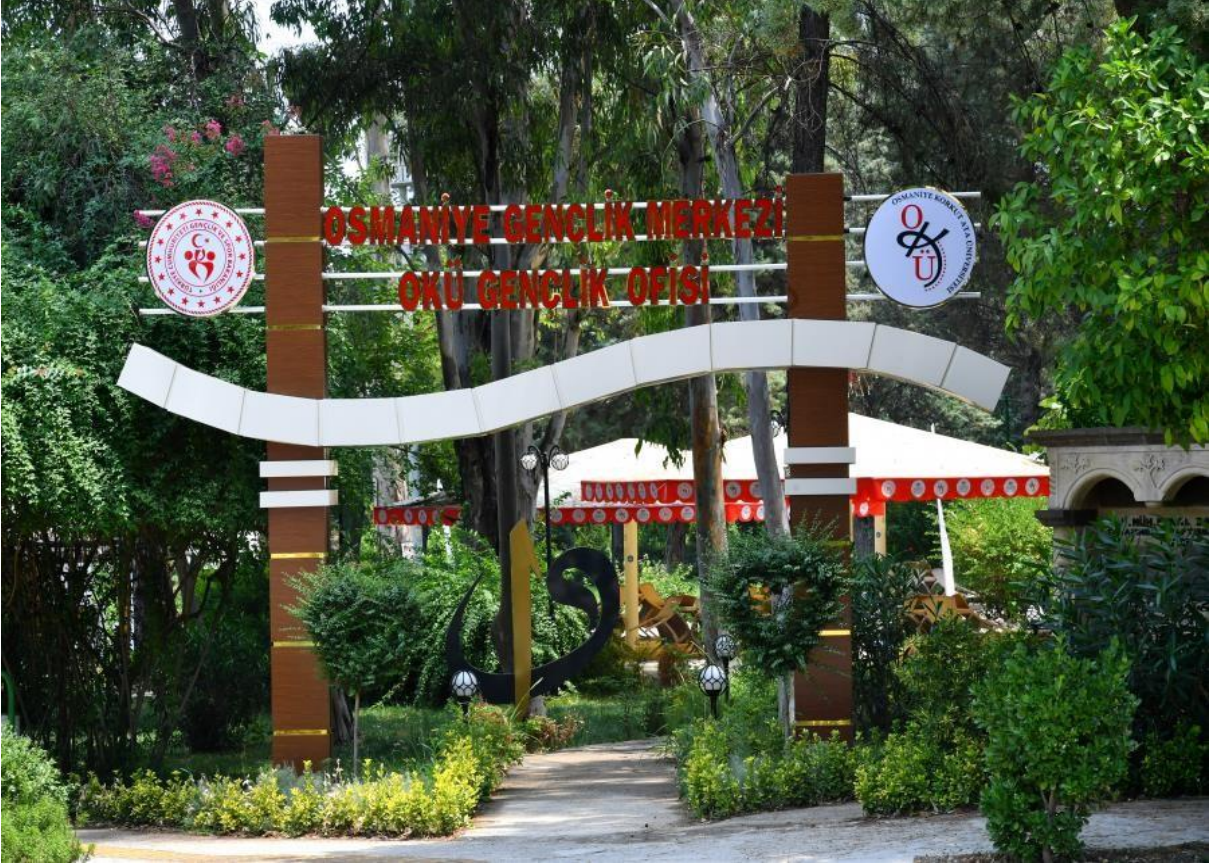
Resim 5: Osmaniye Gençlik Merkezi OKÜ Gençlik Ofisi