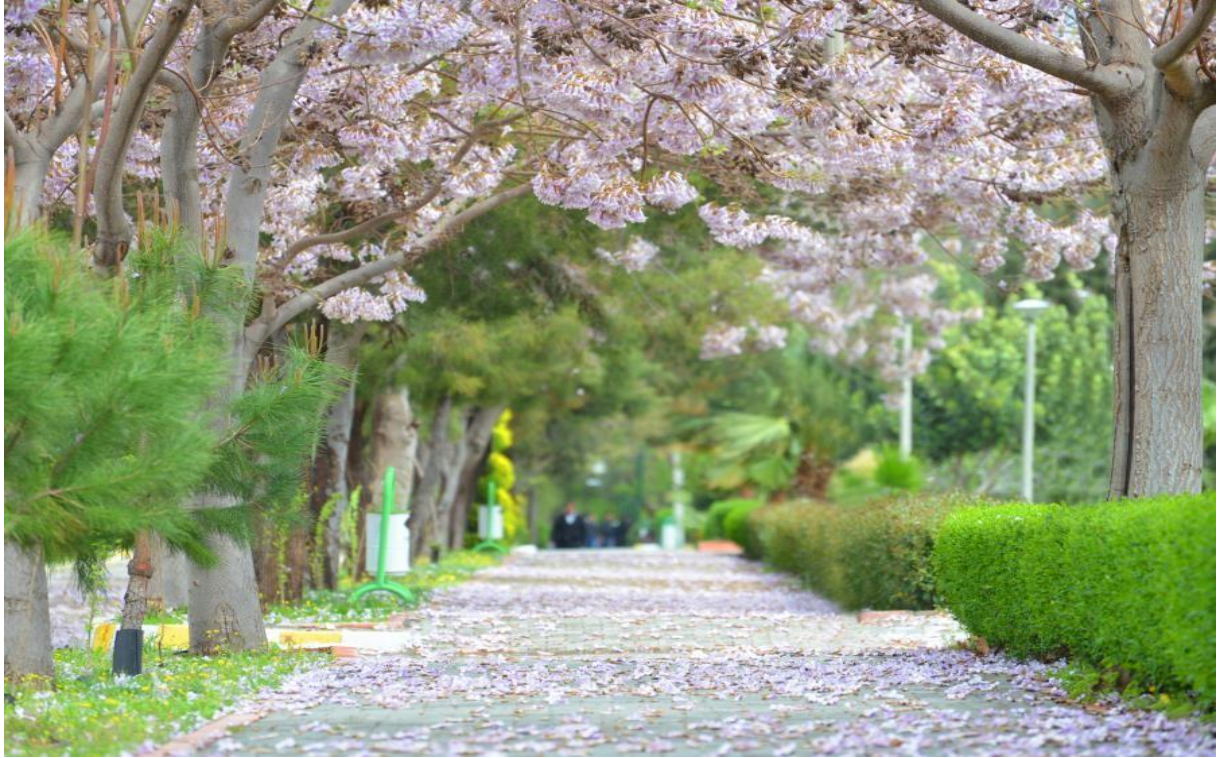
Resim 3: OKÜ Karacaoğlan Yerleşke Alanı İlkbahar