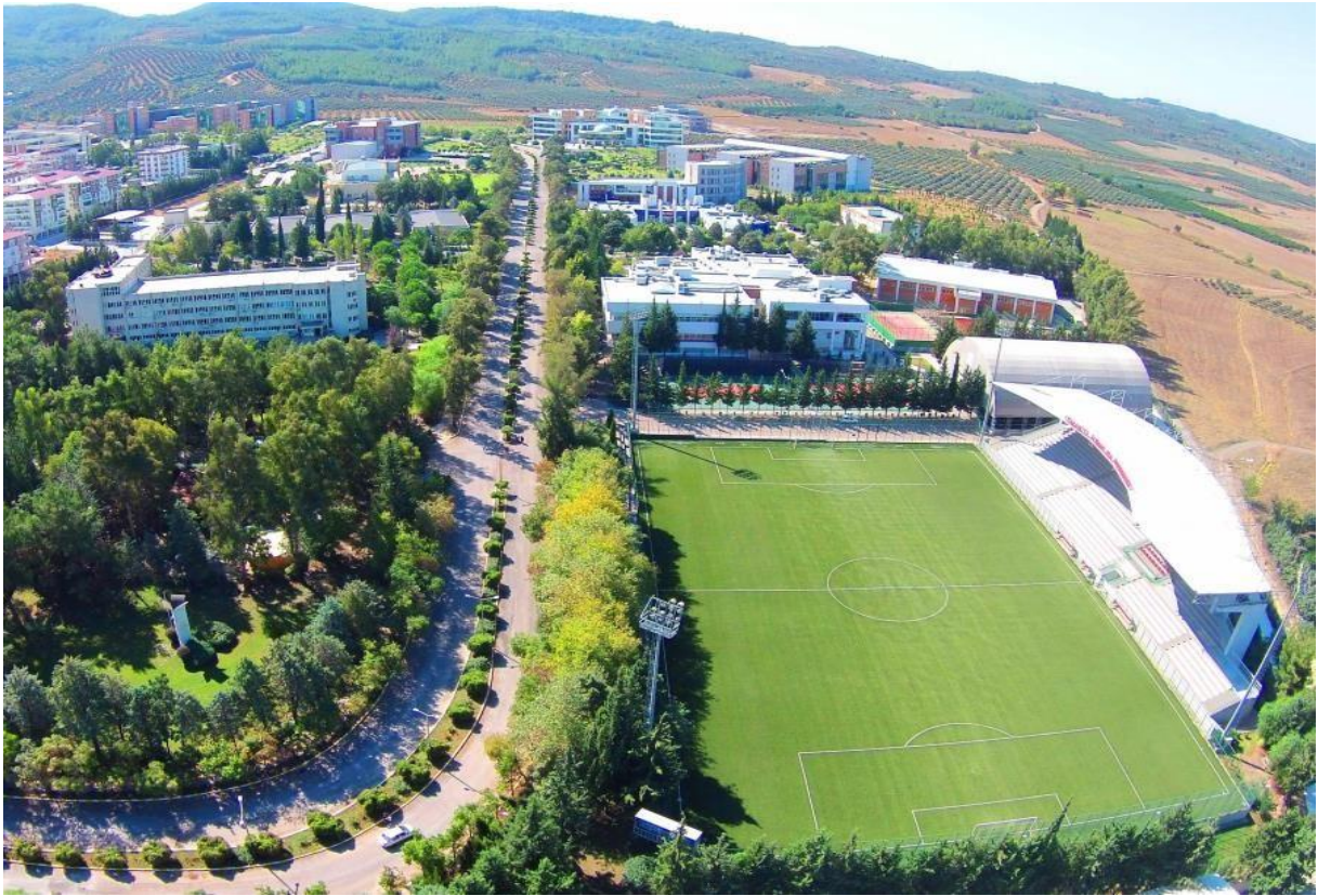
Resim 2: OKÜ Karacaoğlan Yerleşkesi

Osmaniye Korkut Ata Üniversitesinin 2022 yılı itibariyle sahip olduğu fiziki kapalı alanlar hakkındaki bilgi Tablo 1'de detaylı bir şekilde verilmiştir.