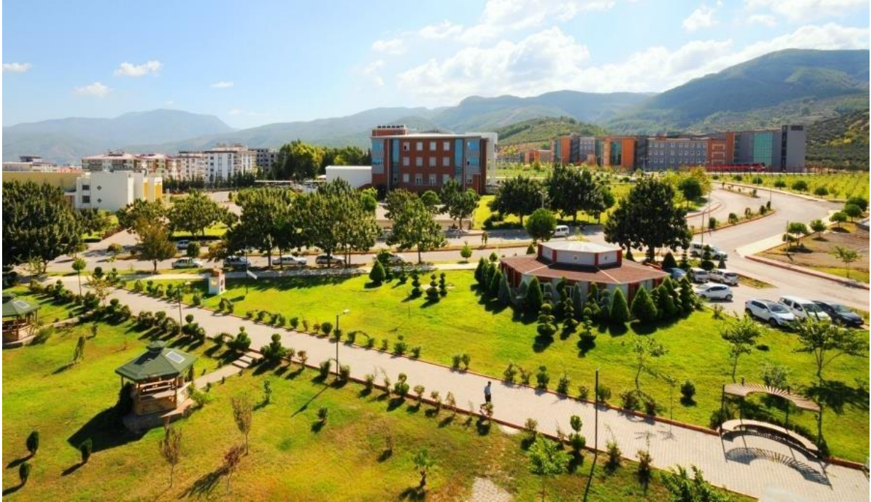
Resim 1: OKÜ Karacaoglan Yerleşkesi

Yükseköğretim kurumları olarak amacımız; yüksek düzeyde bilimsel çalışma ve araştırma yapmak, bilgi ve teknolojiyi üretmek, bilim verilerini yaymak, ulusal alanda gelişme ve kalkınmaya destek olmak, yurtiçi ve yurtdışı kurumlara işbirliği yapmak suretiyle bilim dünyasının seçkin bir üyesi haline gelmek, evrensel ve çağdaş gelişmeye katkıda bulunmaktır.