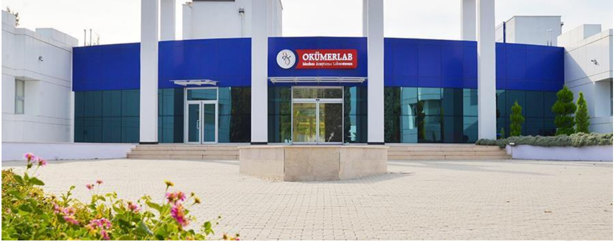
Resim 6: OKÜ Merkezi Araştırma Laboratuvarı

bazlı Tempo cihazı ile de kalite indikatörü analizleri yapılabilmekte ve çok kısa sürelerde sonuç verilebilmektedir. Gıda, Tarım ve Hayvancılık Bakanlığı'nın 28145 sayılı "Gıda Hijyeni Yönetmeliği"nin uygulanması ile OKÜGIDA Mikrobiyoloji Analiz Laboratuvarının donanımı ve bilgi birikimi sayesinde bölgedeki gıda ve yem işletmelerine büyük katkı sağlaması beklenmektedir.