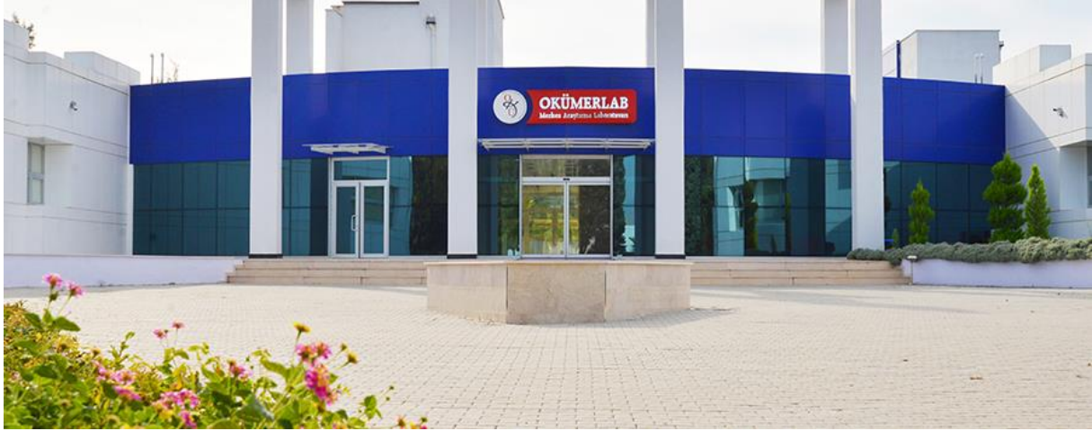
Resim 7: OKÜ Merkezi Araştırma Laboratuvarı

bazlı Tempo cihazı ile de kalite indikatörü analizleri yapılabilmekte ve çok kısa sürelerde sonuç verilebilmektedir. Gıda, Tarım ve Hayvancılık Bakanlığı'nın 28145 sayılı "Gıda Hijyeni Yönetmeliği"nin uygulanması ile OKÜGIDA Mikrobiyoloji Analiz Laboratuvarının donanımı ve bilgi birikimi sayesinde bölgedeki gıda ve yem işletmelerine büyük katkı sağlaması beklenmektedir.