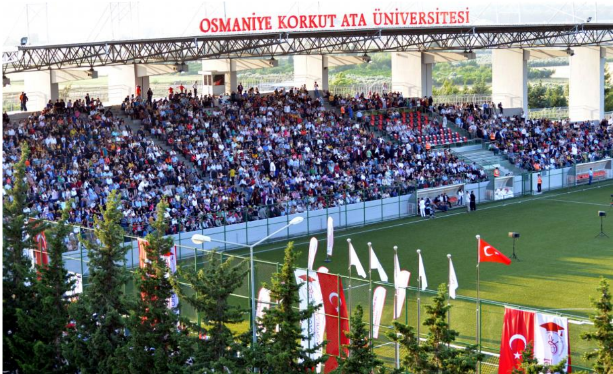
Resim 4: OKÜ Karacaoğlan Yerleşkesi Spor Kompleksi