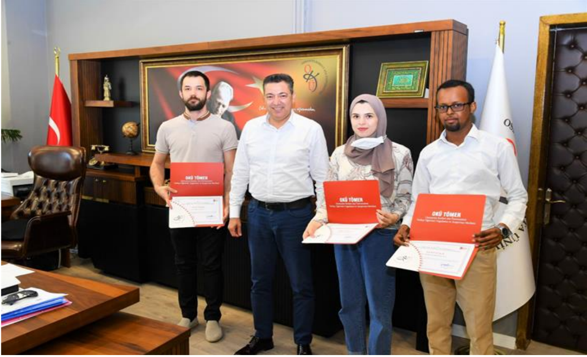
Resim 6: OKÜ TÖMER Katılımcı Sertifika Belge Teslimi