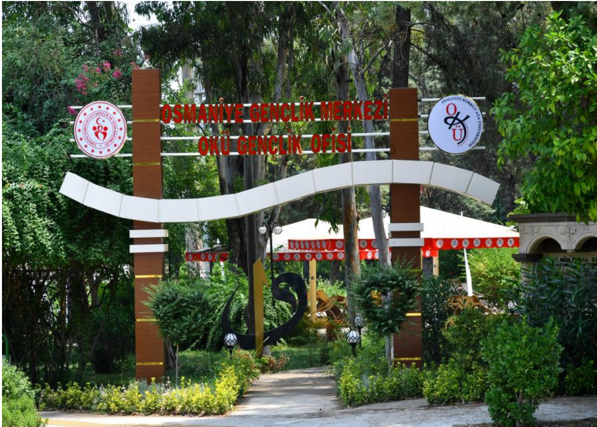
Resim 5: Osmaniye Gençlik Merkezi OKÜ Gençlik Ofisi