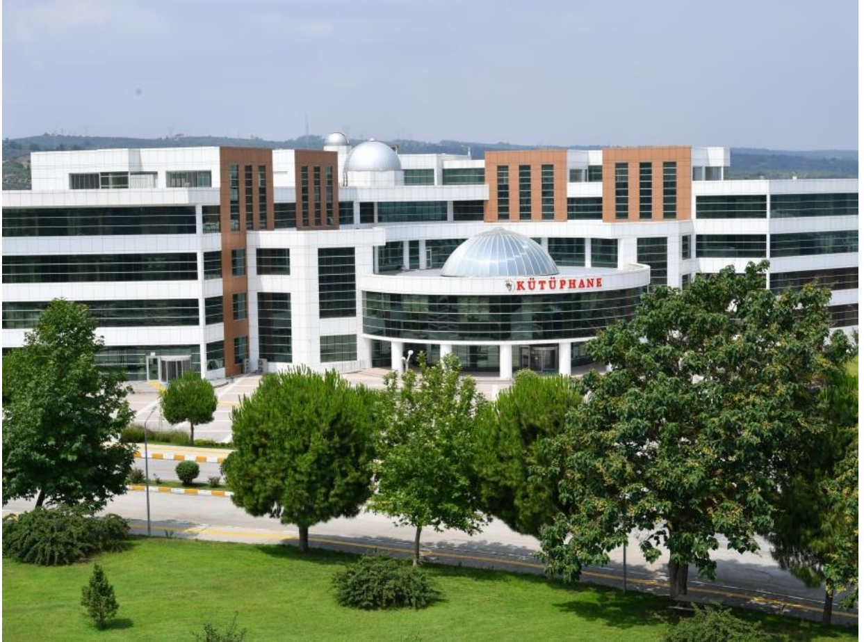
Resim 7: OKÜ Kütüphane