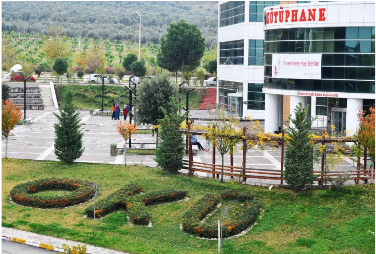
Resim 8: OKÜ Kütüphane