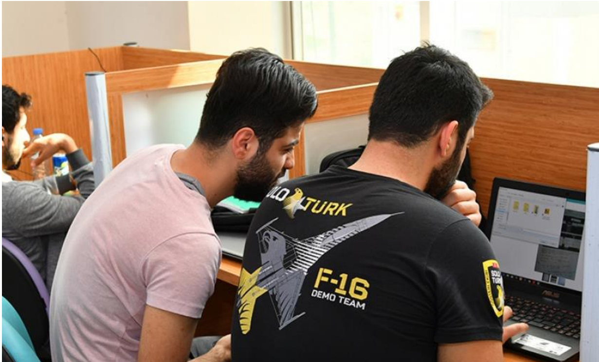
Resim 9: OKÜ Öğrenciler