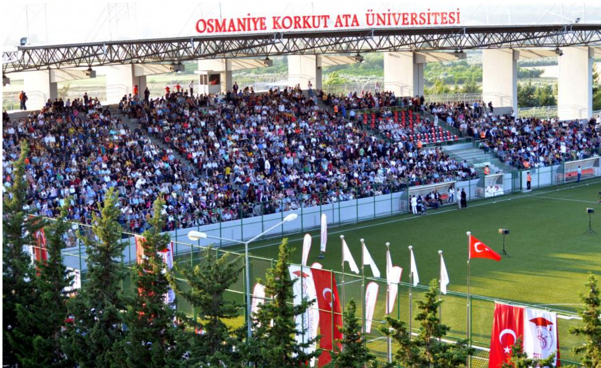
Resim 4: OKÜ Karacaoğlan Yerleşkesi Spor Kompleksi