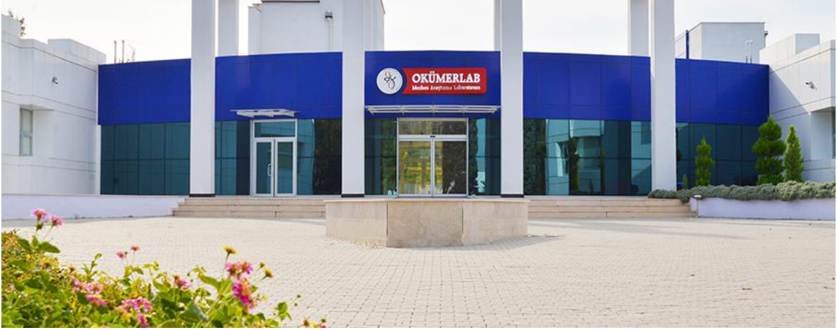
Resim 6: OKÜ Merkezi Araştırma Laboratuvarı

bazlı Tempo cihazı ile de kalite indikatörü analizleri yapılabilmekte ve çok kısa sürelerde sonuç verilebilmektedir. Gıda, Tarım ve Hayvancılık Bakanlığı'nın 28145 sayılı "Gıda Hijyeni Yönetmeliği"nin uygulanması ile OKÜGIDA Mikrobiyoloji Analiz Laboratuvarının donanımı ve bilgi birikimi sayesinde bölgedeki gıda ve yem işletmelerine büyük katkı sağlaması beklenmektedir.