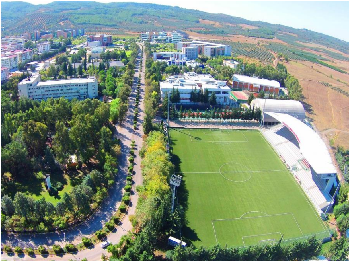
Resim 2: OKÜ Karacaoğlan Yerleşkesi

Osmaniye Korkut Ata Üniversitesinin 2020 yılı itibariyle sahip olduğu fiziki kapalı alanlar hakkındaki bilgi Tablo 1'de detaylı bir şekilde verilmiştir.