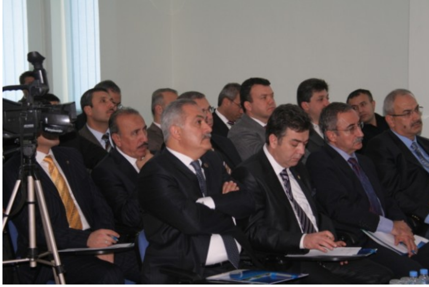
Şekil 4. SWOT Çalıştayı'na Osmaniye Protokolü Üst Düzeyde ve Aktif Olarak Katıldı

Bu çalışmanın en önemli kısıtları ikincil verilerin yetersizliği ve birincil veri elde etmek için kullanılan anket ve grup toplantılarına katılımın beklenenin altında olmasıdır. Bununla birlikte bu durum temsil yeteneği açısından bir soruna yol açmamaktadır. Ayrıca zaman ve maliyet kısıtı da göz ardı edilmemesi gereken kısıtlardandır. Ancak çalışmanın akademik bir süreç içinde gerçekleştirilmesi, daha fazla katılımcı görüşünün yer alması ve geniş kapsamlı olması yönüyle Osmaniye için yapılacak stratejik planlamalarda önemli katkılar sağlaması umulmaktadır.