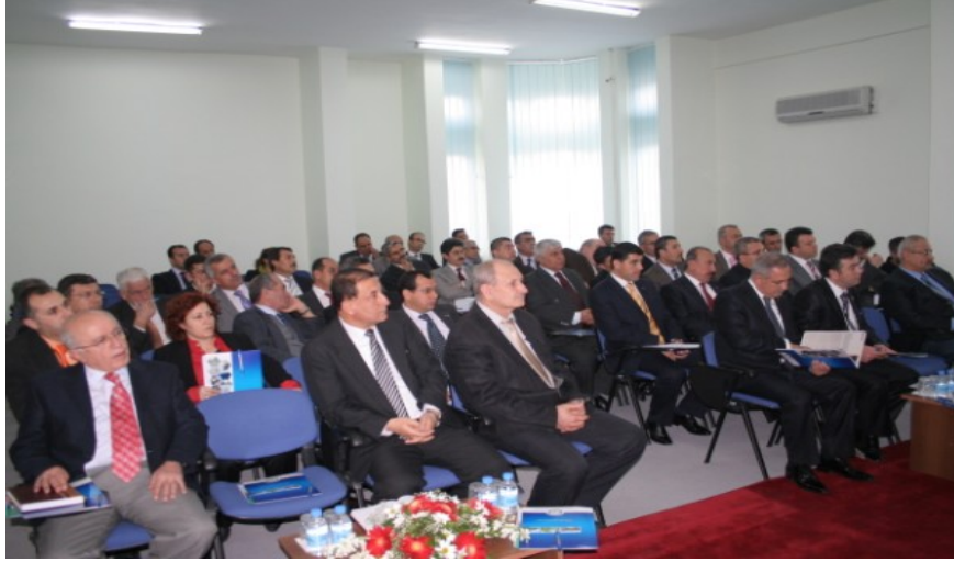
Şekil 2. Osmaniye Korkut Ata Üniversitesi'nde Yapılan SWOT Çalıştayına Katılanlar

Çalıştayda, Osmaniye hakkında genel bir değerlendirme, genel hatlarıyla SWOT Analizi sonrasında ise hazırlanan SWOT matrisi katılımcılara sunulmuştur. Katılımcıların bu matrise ilave etmek istedikleri güçlü ve zayıf yanlar ile fırsat ve tehditler sorulmuş ve tartışmaya açılmıştır. Tartışma sonucunda ortaya çıkan yeni fikirler oyçokluğu sağlanması halinde SWOT matrisine eklenmiştir. Katılımcılardan, tüm aşamalar sonucu ortaya çıkan entegre SWOT matrisinde yer alan güçlü ve zayıf yanlar ile fırsat ve tehditleri sıralama yaparak puanlamaları istenmiştir. Katılımcılar matriste yer alan unsurları en önemlisine 10 puan vererek en fazla 10 unsuru sıralamışlardır.