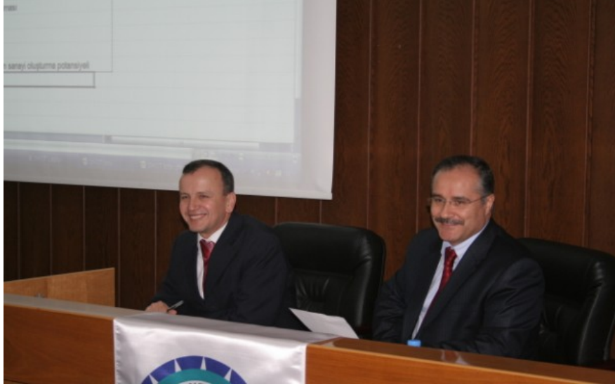
Şekil 3. Osmaniye Korkut Ata Üniversitesi'nde Yapılan SWOT Çalıştayı

Yapılan sıralama sonucu her bir güçlü ve zayıf yan ile fırsat ve tehdit maddesinin aritmetik ortalaması alınarak bu maddelerin önem önceliği tespit edilmiştir. Dördüncü bölümde bu maddelerin önem sırasına dizilimi esas alınarak oluşturulan bulgulara ikincil veriler de desteklenerek yer verilmiştir.