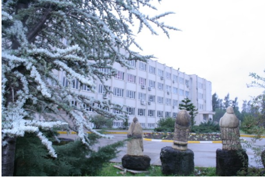
Şekil 1. Osmaniye Korkut Ata Üniversitesi'nden Bir Görünüm

Bu çalışmada, Osmaniye ilinin güçlü ve zayıf yanları ile il için var olan ve/veya var olabilecek fırsat ve tehditler belirlenmeye çalışılmıştır.